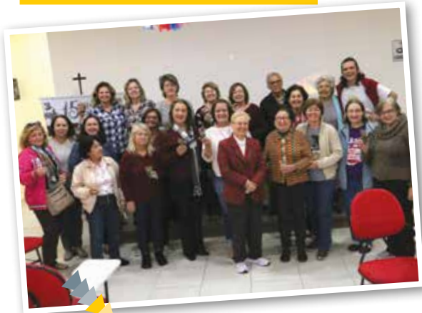
Encontro de Coletivo de Aposentados do mês de junho