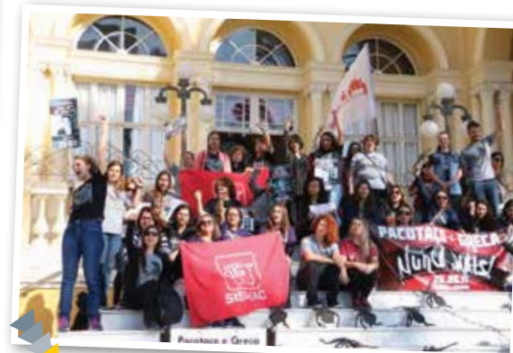
Magistério fez ato na Câmara Municipal no dia 26 de junho, para marcar um ano da aprovação do pacote