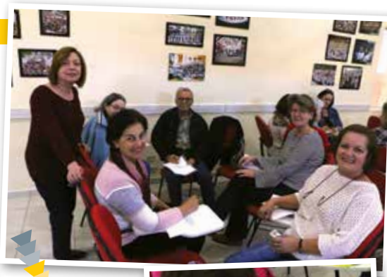
Reunião de junho avançou na escrita do Livro de Memórias